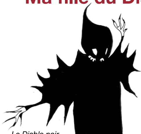
Le Diable noir