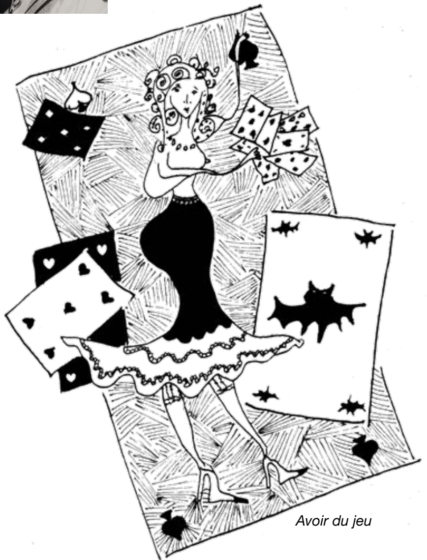
Avoir du jeu

Les dessins originaux de Croune peuvent faire l'objet d'une exposition.