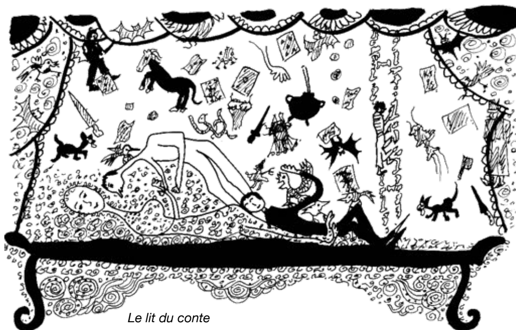
Le lit du conte